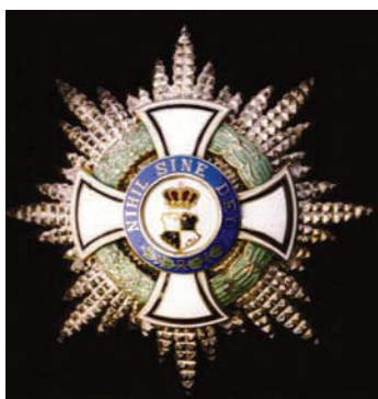
Кнежевски Породични орден Хоенцолерна, звезда Великог командира. The Princely House Order of Hohenzollern, Grand Commander Star.

Грб Београдске Поликлинике Св. Никола: на црвеном пољу сребрни крст између четири исте такве одрубљене главе медицинских сестара са белим капицама са црвеним крстом.