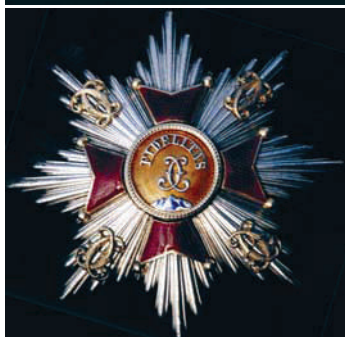
Баденски великовојводски породични орден верности. Baden's Grand-Ducal House Order of Fidelity.