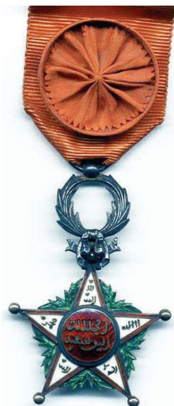
Шерифски алавидски орден, горе официјерска класа, 1. период, доле иста класа, 2. период. Sharifian Order of the Alawids above: 1 period Officer's Badge, obverse, below the same class, 2nd Period.