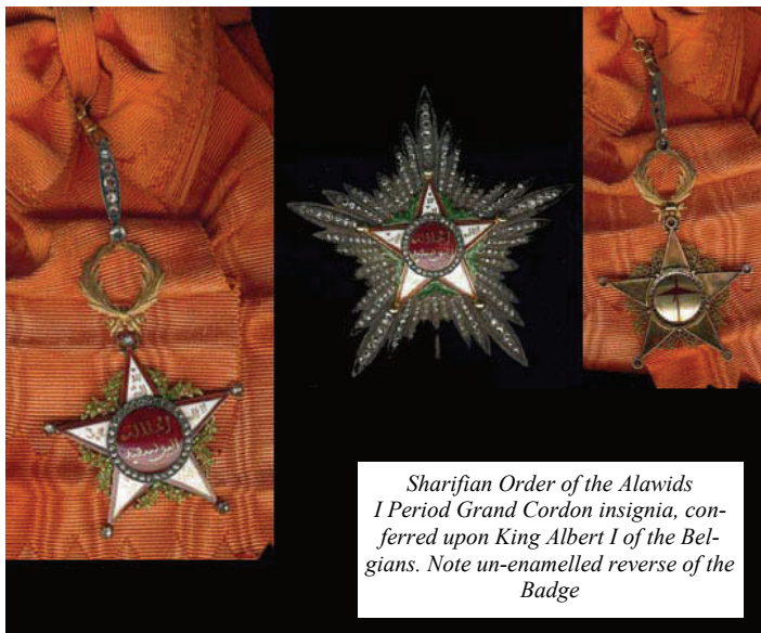
Sharifian Order of the Alawids I Period Grand Cordon insignia, conferred upon King Albert I of the Belgians. Note un-enamelled reverse of the Badge