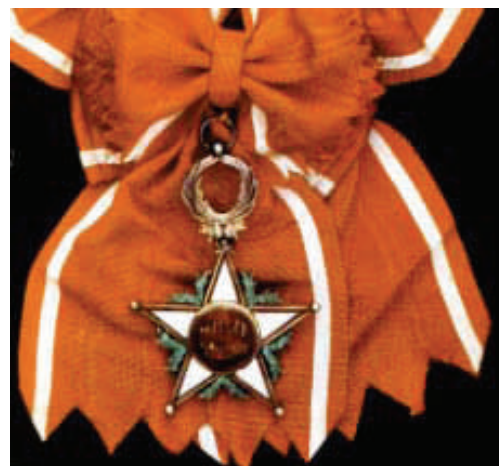
Шерифски алавидски орден, Велика лента, 2. период. Sharifian Order of the Alawids Grand Cordon Badge and Star, II Period.