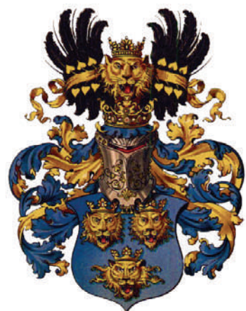
Грб Далмације, према Штрелу. Stroehl's Arms of Dalmatia.

Витез Јанко и нестанак једне велике српске далматинске племићке породице која се прославила под четири разна презимена