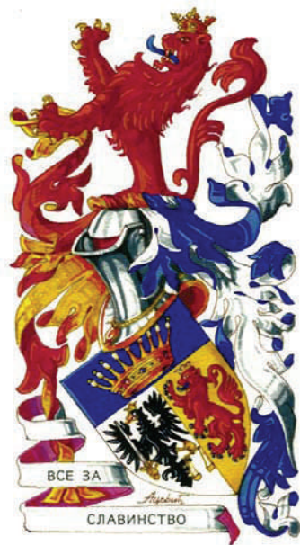
Грб грофова Деде-Митровић-Јанковић. Arms of Counts Dede-Mitrovich-Jankovich.