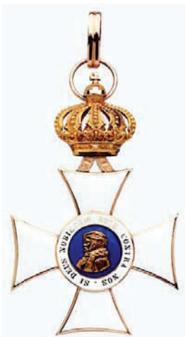
Орден Филипа Великодушного, војводства Хесен-Касел. Order of Philipp I The Magnanimous, of the Duchy of Hesse-Cassel.

1683), daughter of Elector Georg Wilhelm of Brandenburg