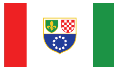
Застава Бошњачко-Хрватске Федерације БиХ.

Two proposals for Bosnia-Herzegovina flag, submitted by Moslem SAD-Party.