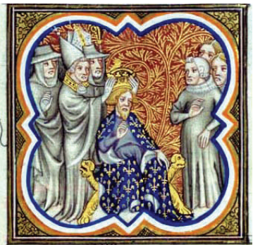
Царска крунисања Карла Великог (горе) и Лудвига Побожног (доле), према минијатурама из Фроасарових Хроника, Национална библиотека, Париз. Imperial Coronations of Charlemagne (above) and Louis le Pieux (below), from Froissart's Chroniques, Bibliotheque Nationale, Paris.