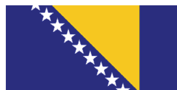
Застава Босне и Херцеговине. Flag of Bosnia and Herzegovina.

Flag of the Bosniak/Croat Federation of Bosnia and Herzegovina.