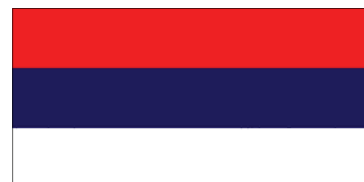
Застава Републике Српске. Flag of Republic of Srpska.