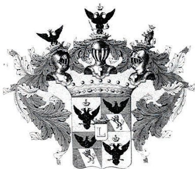
Грб грофова Подгоричана према "Бархатној књизи". Arms of Counts Podhoriczany according to "Velvet Book".