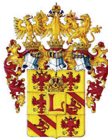
Погрешни двотонски грб грофа Ђорђа Бранковића од Подгорице за коју се дуго мислило да је аутентичан. Erroneous arms of Count George Brankovich of Podgoritza in two tones, which was believed to be true representation of his armorial achievement.