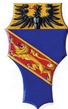
Погрешна претпоставка: нетачна реконструкција боја грба Божидача Вуковића у интерпретацији Д. Ацовића. Erroneous reconstruction: wrong attempt at reconstruction of tinctures in arms of Bozhidar Vukovich, by D. Acovic.