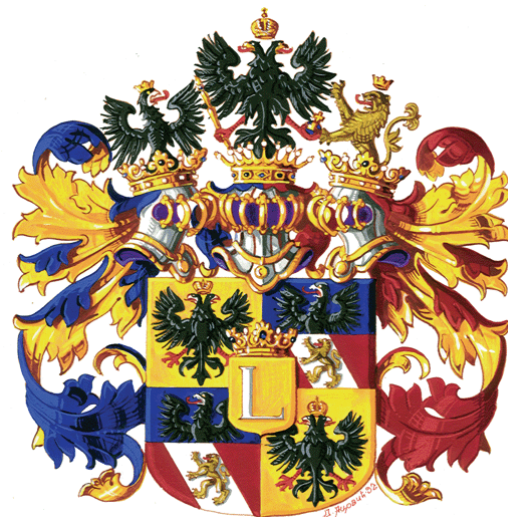
Грб грофова Подгоричана у интерпретацији Д. Ацовића. Arms of Counts Podhoriczany, in heraldic interpretation of D. Acovic.