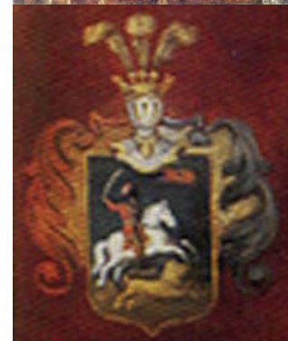
Јован Текелија (сасвим горе), Сава Текелија по портрету Мор Тана из 1861. (доле) и увећан грб са истог портрета. John Tekeliya (above) and Sava Tekeliya, according to the Than Mor portrait (below), including enlarged representation of Tekeliya coat of arms (three feathers crest version).