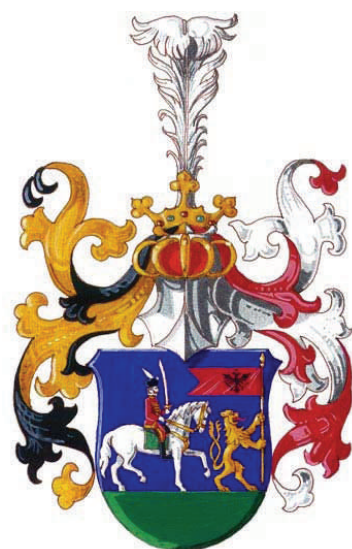
Грб породице Поповић–Текелија од Кевермеша и Визеша. Arms of nobles Popovic-Tekelija de Kevermes & Vizes.

Петар Поповић–Текелија, напустивши родитељски дом, потражио је срећу у Русији. Његова каријера у служби цара била је спектакуларна; сматра се да све до 20. века ни један официр Србин није начинио такву војну каријеру као он! У Седмогодишњем рату стекао је велико искуство борећи се у саставу јединица које је Катарина Велика послала у помоћ Марији Терезији. Осим искуства и чина стекао је и гадну рану на