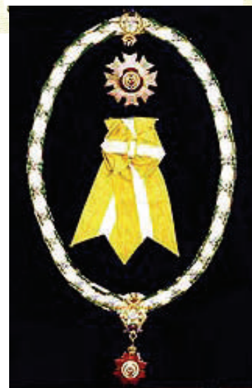
Најчењенији Орден Краљевске породице Келантана. The Most Esteemed Royal Family Order of Kelantan (Darjah Kerabat Yang Amat Di-Hormati).