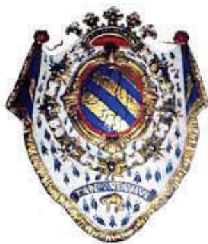
Грб маркиза де Тразењиа. Arms of the Marquises of de Trazegnies.

De Trazegnies Family, unavoidably mentioned when Adumbration is discussed, belongs to the feudal nobility of Brabant. They were granted title of Marquises on February 8th 1614, and inscribed as Marquises de Trazegnies d'Ittre in the Province of Namur since May 30th 1843.