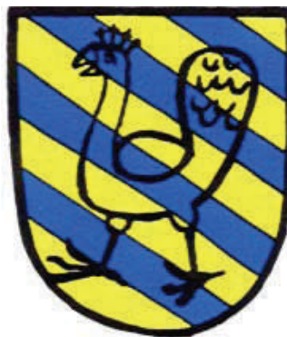
Грб породице Сен-Морис, господара Монпаона у Руергу, према Лијешком грбовнику из 1450. Arms of the House of St. Maurice, Lords of Montpaon, after Armorial de Liège , 1450.

У погледу настанка хералдичке сенке, печат Жила де Тразењиа нам се чини прилично индикативним. Као да је лав,