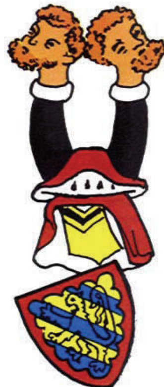
Грб породице де Тразењиа, Хенегау, око 1380. године. Arms of de Trezegnies, Hainaut, cca. 1380.

outline is any other tincture or metal, it has to be blazoned clearly, and has to conform to the rule of superposition of tinctures or metals.