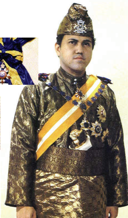
Исмаил Петра, Султан од Келантана. Ismail Petra, Sultan of Kelantan.