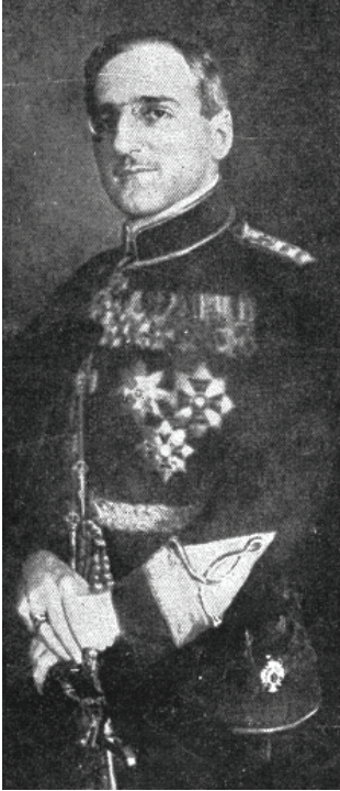
Краљ Александар са пољским орденима Virtuti militari и Polonia restituta, поред Карађорђевог звезде. King Alexander, displaying Star of Karageorge and two Polish Orders (Virtuti Militari and Polonia Restituta).