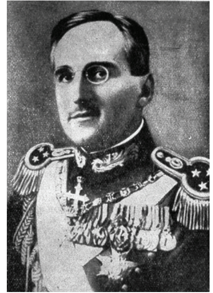
Краљ Александар у униформи румунског пуковника. О врату носи Орден Михајла Храброг и ланац Ордена Каро-ла I, ком ордену припадају и лента и звезда. King Alexander in the uniform of the Colonel of his Romanian Regiment, wearing neck Badge of Order of Michael the Brave, Collar, Sash and Star of Order of Carol I.