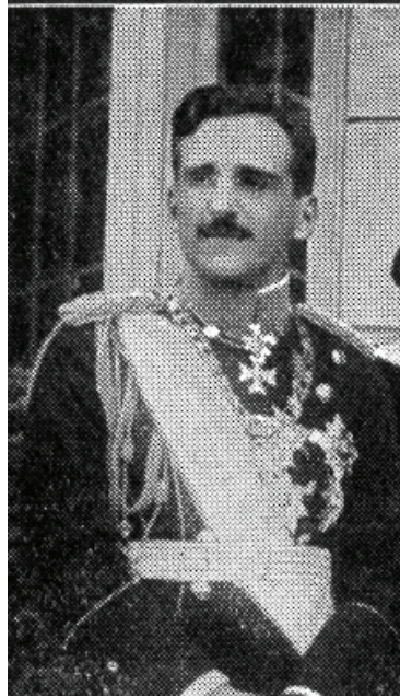
Краљ Александар на крштењу будућег Краља Петра II, носи руски Орден Св. Георгија 2. степена, Краљевски викторијански ланац, ланац и ленту Ордена Карола I, и звезде Карола I, Купатила, Карађорђевог звезде са мачевима и Бе-лог орла са мачевима. King Alexander, at the Baptism of the future King Peter II, displays neck badge of Russian St. George Order 3rd Class, Royal Victorian Chain, Collar and Sash of Romanian Carol I Order, and stars of the Orders of Carol I, Bath, Star of Karageorge with swords and White Eagle with swords.